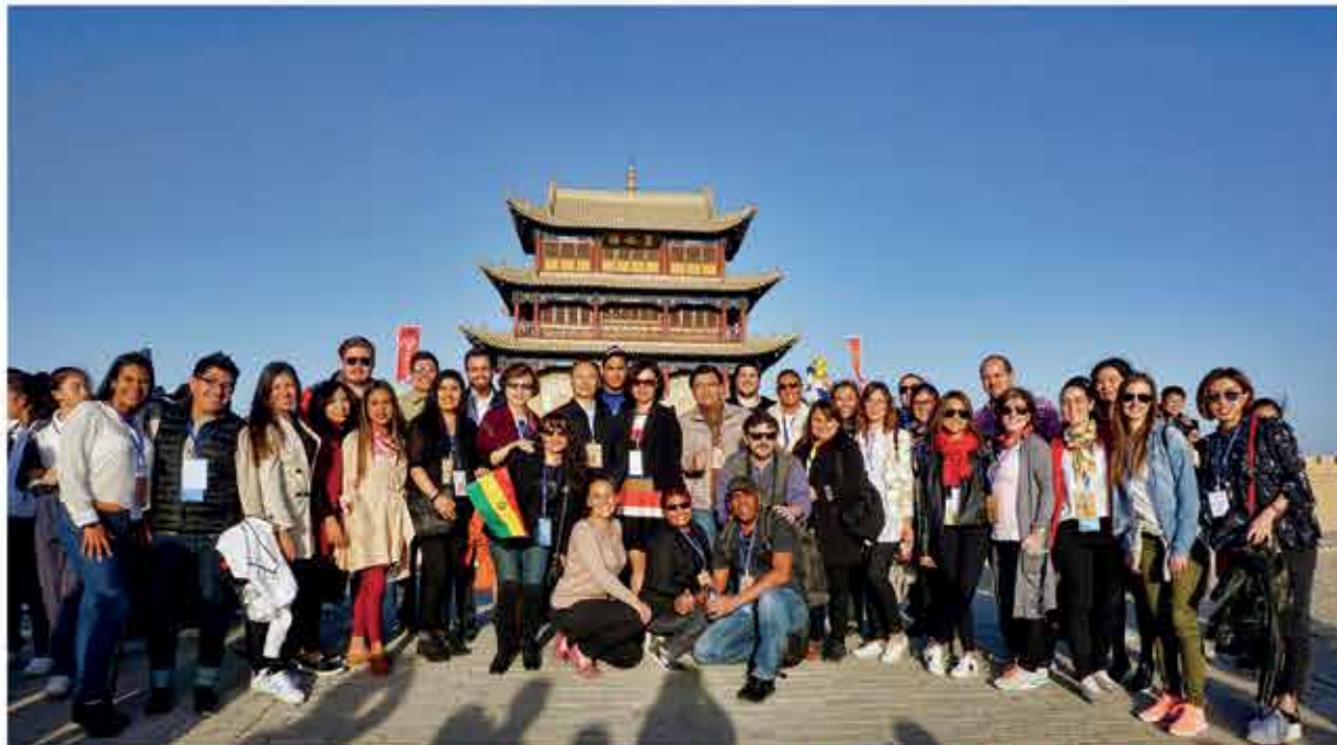
Participantes del Seminario junto a Directivos del Instituto SAPPFT, llegando al acto inaugural del "VI Festival Internacional de Cortometrajes de China", realizado en el paso de la Gran Muralla, Jiayuguan, China.

Coordinadora de Comunicación y Difusión - RR.PP. UMSS