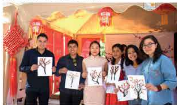
Presentación de varias actividades: demostraciones de caligrafía china, kung fu y distintos tipos de manualidades tradicionales.

El embajador agradeció al rector y a la decana de la Facultad de Humanidades por el apoyo brindado estos 5 años de gestión y, por su parte, el rector agradeció también a la embajada por el apoyo brindado estos años, comprometiéndose ambos a trabajar en el desarrollo mutuo entre China y Bolivia, para conseguir más profesionales emprendedores en el idioma Chino Mandarín y la Cultura China, para que ellos puedan optar por mayores beneficios y un futuro mejor en nuestro país.