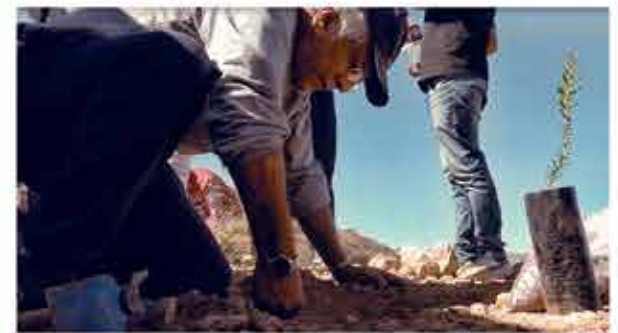
El Rector procede a plantar un arbolito.

El Rector también informó que la universidad busca proveer de especies forestales a municipios con los que tiene convenios y se hagan cargo de la reforestación. Considera que San Simón debería ser la fuente de provisión de especies forestales en todo el departamento, mediante el Centro de Biotecnología y Nanotecnología, que a través de procedimientos biotecnológicos hará posible la producción de alrededor de un millón de plantines por año.