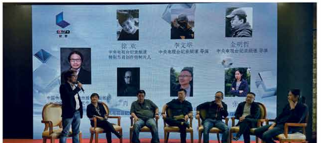
Directores y productores cinematográficos de China, participan del panel de expositores en el VI Festival Internacional de Cortometrajes, realizado en Jiayuguan, China.