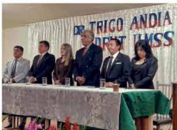
Autoridades universitarias durante el acto.