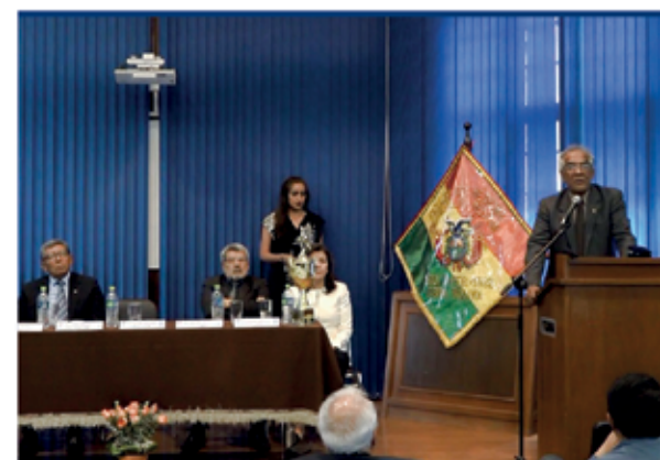
Der: Rector de la UMSS hace uso de la palabra durante el acto.