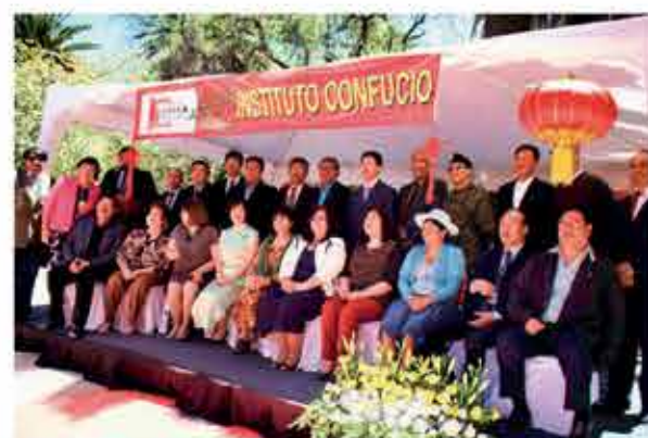
Autoridades departamentales, autoridades administrativas y académicas de la UMSS, en el "Día del Instituto Confucio".