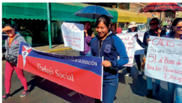
Participación del CUADIS en actividades de apoyo a personas con discapacidad

El año 2009, el XI Congreso de Universidades del sistema boliviano emite la Resolución R.U. 09/09, en base a la ley 1678 "de las personas con discapacidad", "Que autoriza el ingreso libre de bachilleres con algún tipo de discapacidad, de todos los departamentos a las diferentes universidades que conforman el sistema de la universidad boliviana". Asimismo, instruye a las universidades la creación de unidades especializadas, destinadas a la atención de las estudiantes con discapacidad, de acuerdo a las políticas de bienestar estudiantil que existen en cada universidad. Resolución emitida tomando en cuenta la ley 1678 de 1995 de las personas con discapacidad. El año 2011, la Universidad Mayor de San Simón, mediante R.R. 16/11, de 4 de febrero de 2011, aprueba llevar adelante una consultoría que permita encarar la creación del Centro Universitario de Interacción, Investigación y Formación en la temática de las personas con discapacidad, en sujeción estricta a la normativa universitaria vigente, consultoría que se llevó adelante con fondos IDH, durante 13 meses calendario, a partir de febrero del 2011.