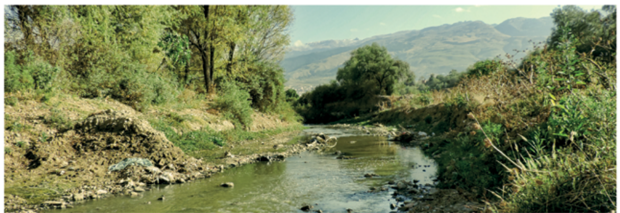
Contaminación que afecta al río Rocha

estas aguas, que traen consecuencias también en la salud humana.