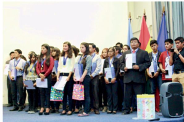
Los mejores estudiantes premiados por la UMSS, gestión 2017.