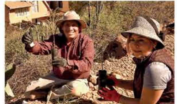
Administrativos participaron de la jornada de reforestación.