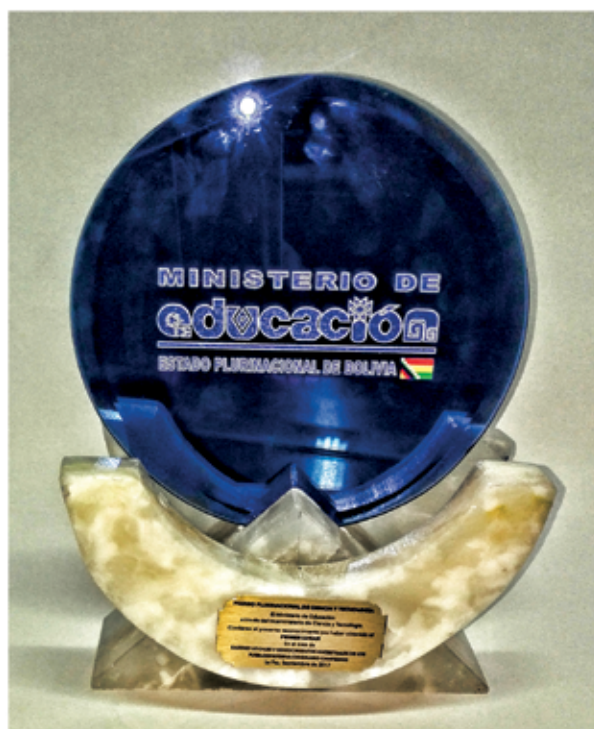
El premio obtenido.

El tercer resultado presenta algunas de las técnicas aplicadas en el proyecto Incallajta, a metales procedentes de excavaciones en el sitio (anillo con lazos y cuentas y una aguja), que han sido sometidos a diversos análisis, incluyendo el Microscopio Electrónico de Barrido y el acelerador