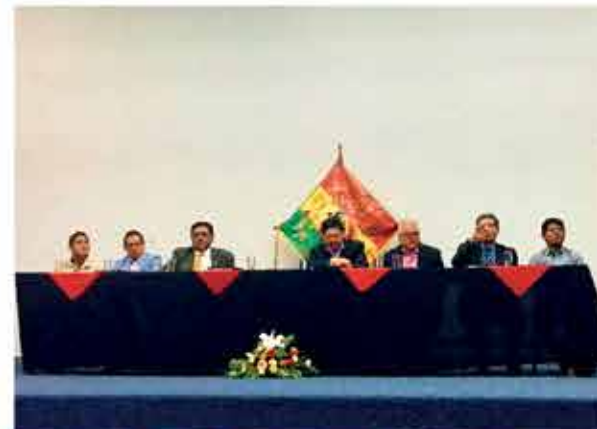
Autoridades Facultativas durante el acto de conmemoración.

Esta unidad académica está estructurada sobre la base de Ciencias Físicas, Matemáticas y Geológicas destinada a la formación integral del Ingeniero Civil, de manera que esté capacitado en el conocimiento científico y tecnológico adquirido por medio de estudio, experiencia y práctica.