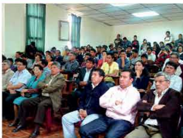
Autoridades académicas, estudiantes e invitados.