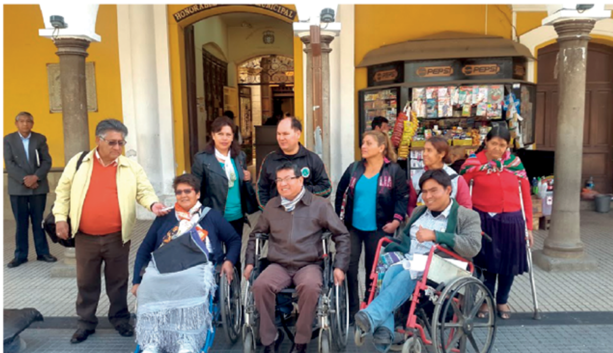
CUADIS apoya a estudiantes con discapacidad.