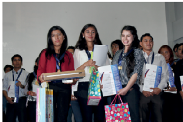
Las tres mejores estudiantes de la UMSS, gestión 2017.