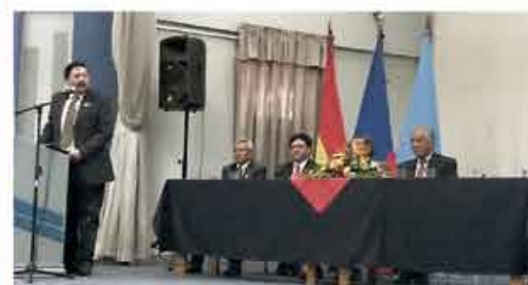
Autoridades durante el acto de conmemoración.

En sesión de honor, la Facultad de Ciencias y Tecnología (FCyT) desarrolló la ceremonia de conmemoración de su trigésimo octavo aniversario. Durante este importante acto académico se realizó la entrega de reconocimientos a investigadores, docentes y estudiantes destacados de la FCyT, así mismo a docentes que se acogieron al beneficio de la jubilación y a familiares de quienes fallecieron.