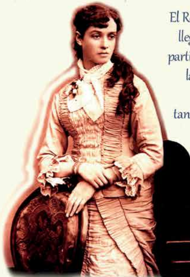
Adela Zamudio - Poetisa y novelista cochabambina 1854 - 1928

Área de Comunicación y Difusión RR.PP. UMSS 2017