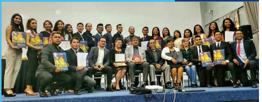
Autoridades de la UMSS (al centro sentados) en el acto de entrega de reconocimientos a los integrantes del Ballet Folklórico UMSS