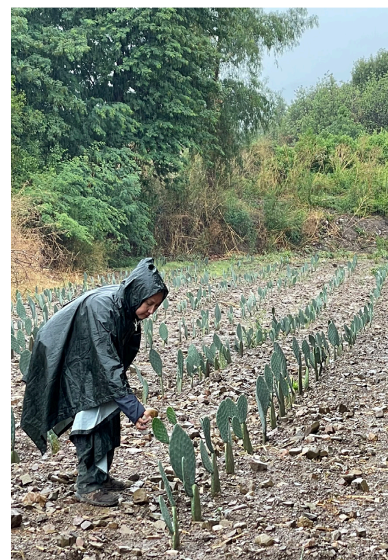
Seguimiento a plantaciones

Efectos positivos ante el cambio climático: generación de tecnología y capacidades, para enfrentar condiciones meteorológicas negativas emergentes al cambio climático; además permitirá la generación de economías locales en zonas deprimidas, evitando pérdidas productivas por enflaquecimiento o muerte de ganado.