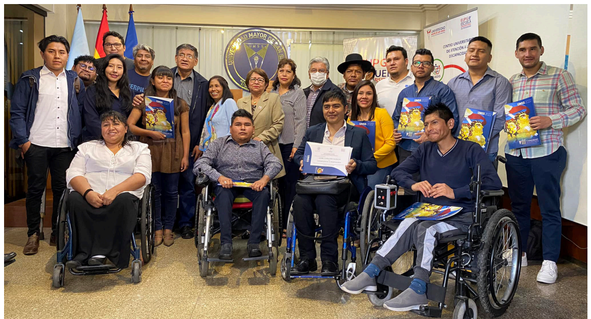
Entrega de reconocimientos a estudiantes con discapacidad de la UMSS (promovido por el CUADIS)