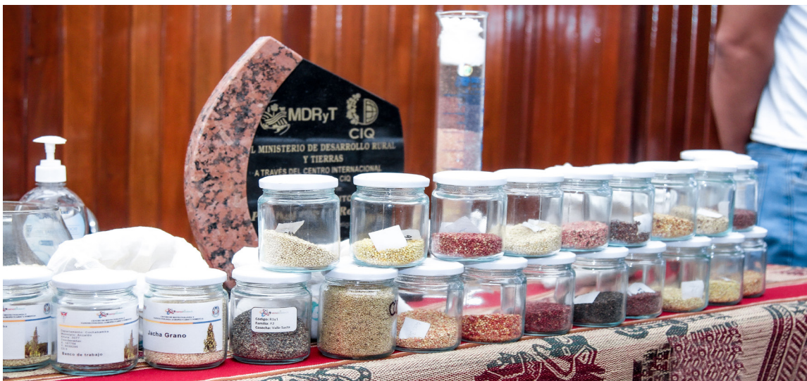
Variedades de quinua generadas a partir de estudios realizados en el Centro de Biotecnología y Nanotecnología de la UMSS

En el PROGRAMA QUÍNUA de la UMSS se continúa trabajando para obtener nuevas y mejores variedades para las tierras bajas de Bolivia. Es así que se han generado las variedades de quinua tropical ARCO IRIS , que tienen granos de colores: negro, rojo, café y la variedad MIX , que naturalmente produce granos de tres colores (blanco, café y negro). También se han generado variedades sin saponina (dulces) y está en proceso la generación de variedades tropicales almidoneras, aceiteras y proteicas, para usos agroindustriales específicos, y de grano grande.