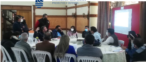
Talleres para el Plan Operativo Anual

La Dirección de Planificación, Proyectos y Sistemas (DPPyS) durante la gestión 2022, ha desarrollado sus funciones enmarcadas en la planificación, seguimiento a ejecución y control de actividades desarrolladas por sus 4 Departamentos: Esta Dirección también: