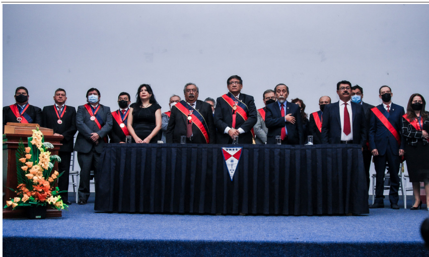
Sesión de Honor del H. Consejo Universitario para la promulgación del Nuevo Estatuto Orgánico de la UMSS