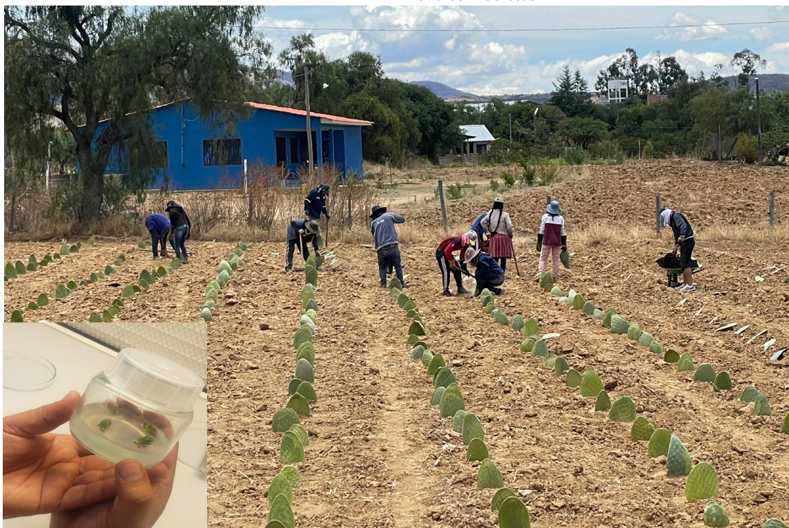
Desarrollo de plantas en medio de cultivo (izq. abajo) / Actividades de plantación de Tuna, en Tarata

contienen un 90% de agua en su composición estructural, convirtiéndose en un reservorio viviente de agua para el ganado.