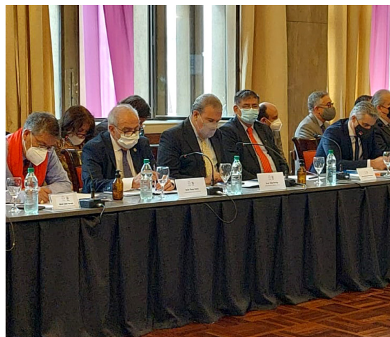
Participación del Rector UMSS en Seminario Internacional Conmemorativo por 30 años de la AUGM, Uruguay.