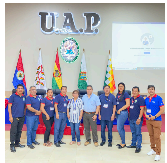
Reunión REDISPOT y RENAP, Cobija 2022

Estas son algunas de las acciones más relevantes desarrolladas por la EUPG durante el 2022, en cumplimiento de lo establecido en el plan operativo anual y las directrices establecidas por las máximas autoridades de nuestra Institución.