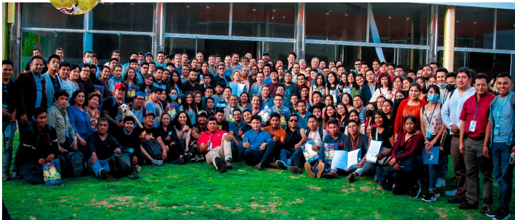
Congresales docentes y estudiantes, junto a autoridades UMSS y personal de apoyo, a la finalización del III Congreso Universitario de la UMSS.