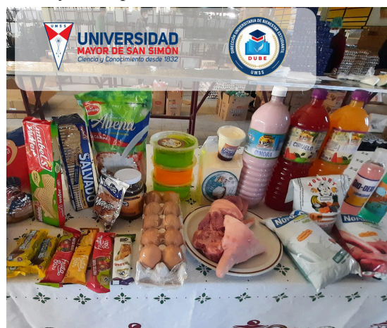
Raciones secas que la DUBE entrega a becarios del Comedor

Creación de aplicación "Amigos de San Simón", en play store.