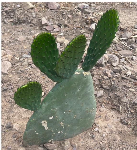
Tuna con rebrotes

Por ello, la tuna forrajera ( Opuntia spp. ), se constituye en una alternativa de forraje viable para el productor pecuario, pues las pencas o cladodios