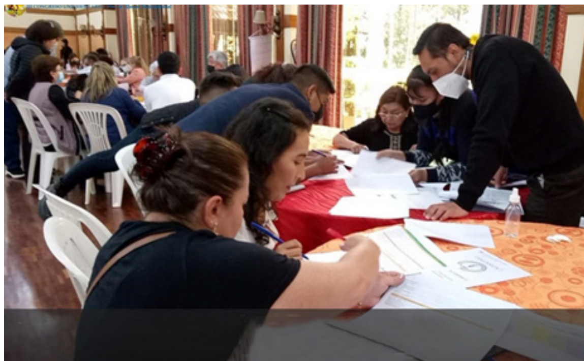
Segundo taller autoevaluación Facultad de Odontología.

En la gestión 2022 se sortearon 123 unidades académicas y administrativas de los POAs de la gestión 2020, unidades que presentaron documentos de descargo para el llenado de formularios de evaluación in situ que incluyen los respectivos indicadores. Se efectivizó la revisión de todos los documentos presentados