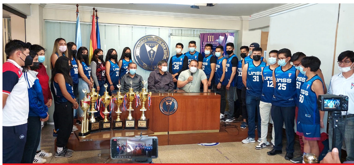
Entrega de trofeos ganados por el Club Universitario San Simón -rama Baloncesto-, al Rector de la UMSS.

• Campeonato Dptal. Basquetbol: Campeón Deptal. en Primera de Honor Damas y Sub Campeón Varones. • Torneos Libobasquet: Campeón Nacional damas y cuarto lugar varones. • XIX Campeonato Clasificatorio a la Liga Promocional Juvenil Voleibol Boliviano: Segundo lugar rama masculina. • XXV Campeonato Liga Superior del Voleibol Boliviano, Cuarto lugar varones. • Campeonato Dptal. Voleibol, actualmente en ronda del Título (juvenil varones, primera de honor damas y varones) • Campeonato Dptal. Fútbol, cat. mayores y menores (damas