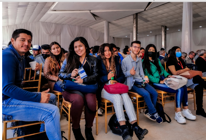
Estudiantes congresales durante el desarrollo del III Congreso Universitario