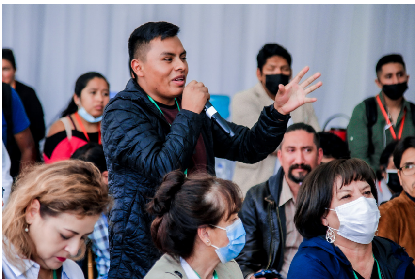
Debates entre estudiantes y docentes congresales, en las Comisiones del III Congreso

Las nuevas disposiciones aprobadas por el III Congreso Universitario ya están en plena vigencia y después de 33 años, ya es posible afirmar que la nueva San Simón está emergiendo".