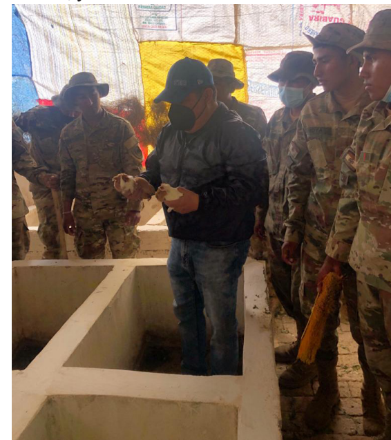
Curso de cuyecultura para oficiales, clases y soldados de Batallones Militares del Departamento de Cochabamba

Este departamento fue restituido durante la gestión 2022, habiendo desarrollado más de 1200 actividades y servicios en torno a: coberturas de prensa, videos informativos, gestión de redes sociales y página web, registro fotográfico y un banco fotográfico; organización de eventos; elaboración de artes y diseños; y elaboración de revistas informativas.