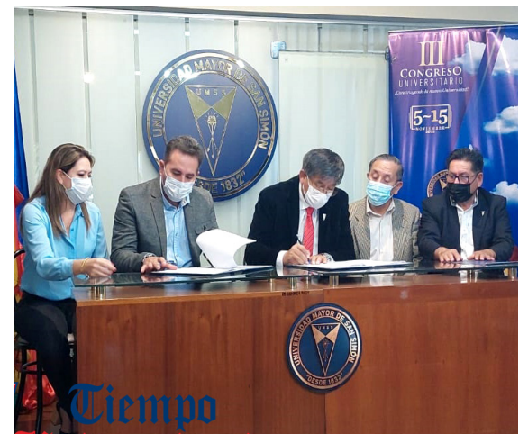
Suscripción de Convenio entre la UMSS y la Gobernación del Beni.

La gestión 2022 se suscribieron 76 convenios: 40 locales, 19 nacionales y 17 internacionales. LaUMSS cuenta, a la fecha, con 236 convenios en vigencia.