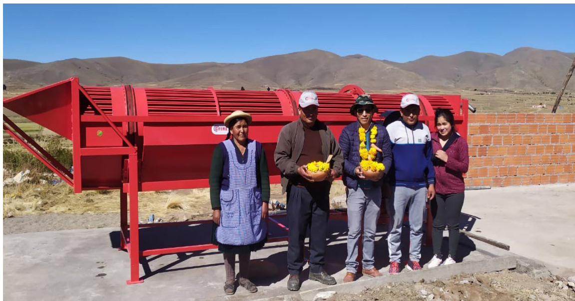
Lavadora de zanahoria, papa, yuca y otros.

Durante el 2022, la empresa universitaria CIFEMA S.A.M. tuvo una gran demanda de maquinaria con características particulares, que exigió la innovación y diversificación en el diseño y fabricación de las mismas. Es el caso de la clasificadora múltiple móvil, que se adecua para clasificar -por calibres- papa, tomate, duraznos, naranjas, limones y otros; la trilladora de orégano; trilladora de leguminosas; descapotadora de maní; trapiches; motoazada mono surco; arado lampa para motoazada; entre varias otras máquinas e implementos agrícolas que se fabricaron en CIFEMA.