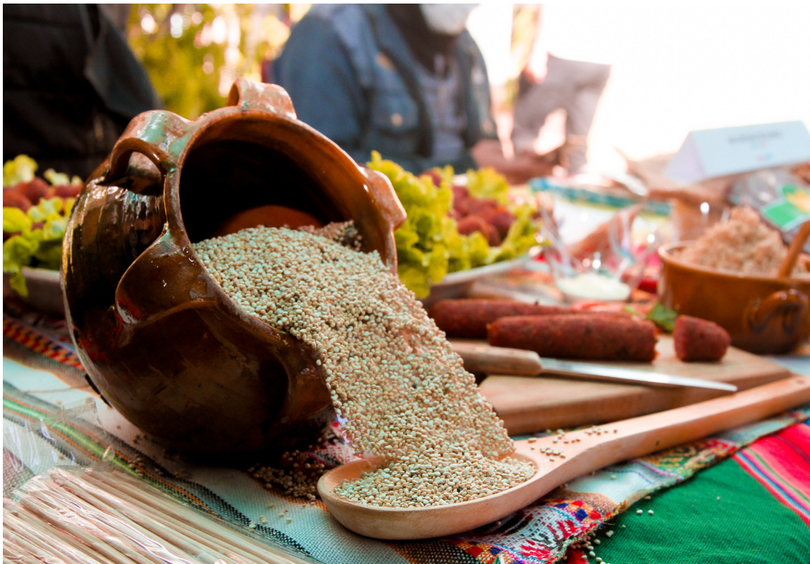
Presentación de productos en base a quinua, para incentivar su consumo en la población

Bolivia es el centro de domesticación de la quinua y el mayor productor de este grano en el mundo, pero su consumo en el país no es frecuente porque la quinua es cara. La única manera de abastecer con quinua a precios bajos a la población boliviana, es produciendo de forma extensiva y mecanizada en las tierras bajas de Bolivia, como son la Amazonia, la Chiquitanía, el Gran Chaco y otras zonas del oriente boliviano. Es por eso que, en la Universidad Mayor de San Simón (UMSS), a través del Centro de Biotecnología y Nanotecnología (CByN) - PROGRAMA QUÍNUA , desde el 2010, se generaron inicialmente 10 variedades de quinua que pueden ser cultivadas en tierras bajas, incluyendo el trópico de Cochabamba.