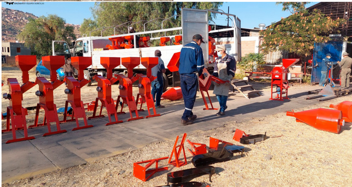
Molino-Picador, altamente demandado. CIFEMA entrega cientos de máquinas e implementos agrícolas a todo el país

"Detrás de cada máquina está la UMSS, apoyando al desarrollo del país"