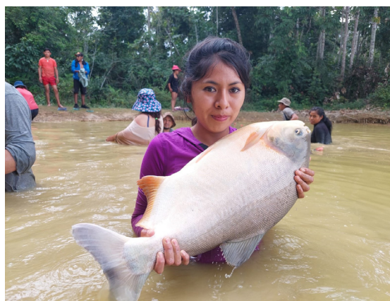
Curso de Piscicultura en Estación Pirahiba de la Fac. Integral del Trópico, dirigido a estudiantes y pobladores

f) Talleres de promoción de Salud Oral integral en recintos penitenciarios, se realizaron con 57 reclusos que son parte del Proyecto, en los diferentes recintos penitenciarios. g) Atención clínica odontológica a niños, niñas y adolescentes en la Aldea Cristo Rey en el marco de un Convenio Interinstitucional.