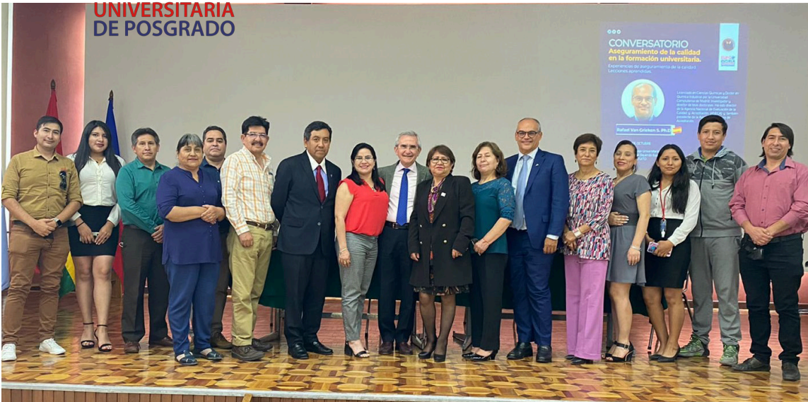
Conversatorio con los profesores de UNIR.

A lo largo de la gestión 2022, la Escuela Universitaria de Posgrado (EUPG) ofertó 273 cursos y programas de formación posgradual, contando con 9943 estudiantes matriculados y 1775 docentes tutores. Como resultado de dichos programas posgraduales se entregaron 4407 certificaciones y se obtuvo una recaudación de 52.547.156,64 millones de bolivianos. Estas cifras son el resultado del trabajo de la dirección, junto a las 16 unidades de posgrado de la Universidad Mayor de San Simón (UMSS).