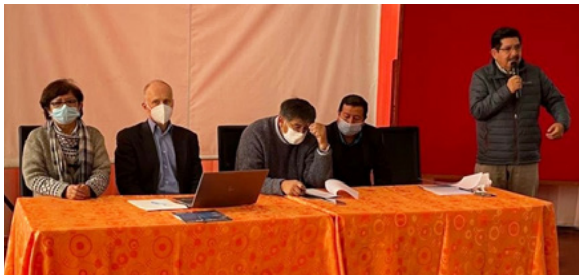
Mapeo y evaluación del Sistema de Gestión de Calidad, la Investigación y el Posgrado - Programa ASDI-UMSS.

Mejorar la infraestructura informática, en términos de servidores y acceso a internet para acompañar procesos de evaluación a distancia.