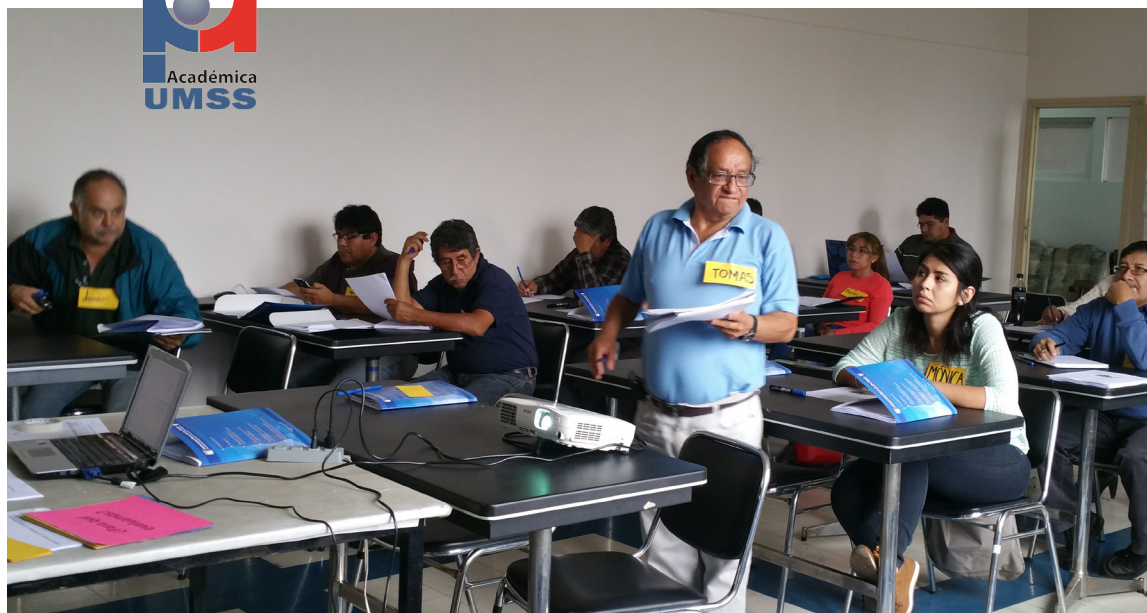
Taller en la Facultad de Arquitectura y Ciencias del Hábitat

La DPA desarrolló las siguientes actividades durante la gestión 2022: