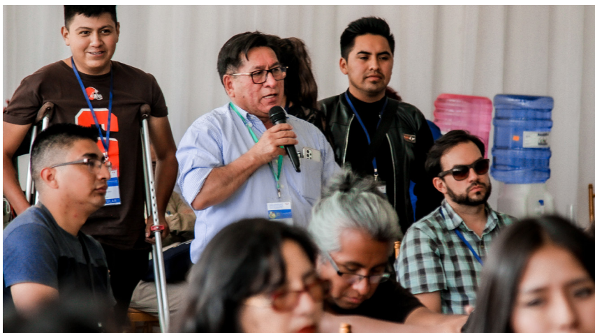
Momentos de debate en las Comisiones del III Congreso Universitario