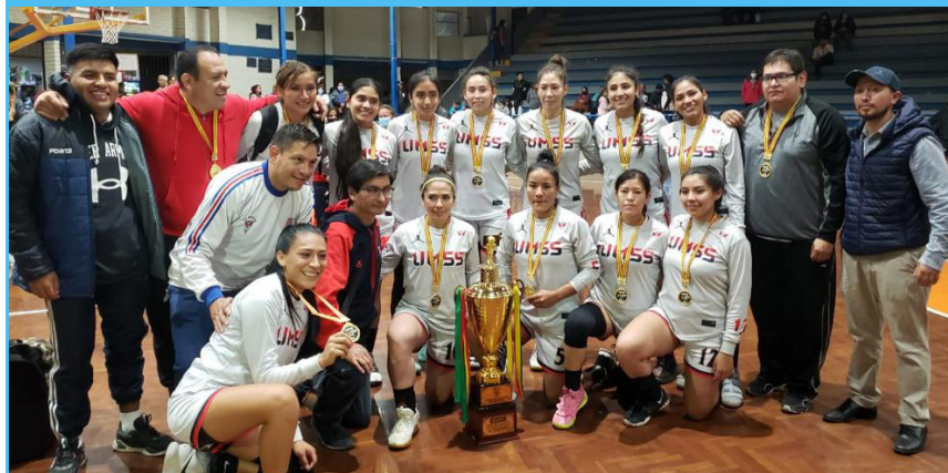
El equipo de baloncesto San Simón junto al cuerpo técnico, con las medallas obtenidas y el Trofeo de Campeón de la Libobasquet damas 2022