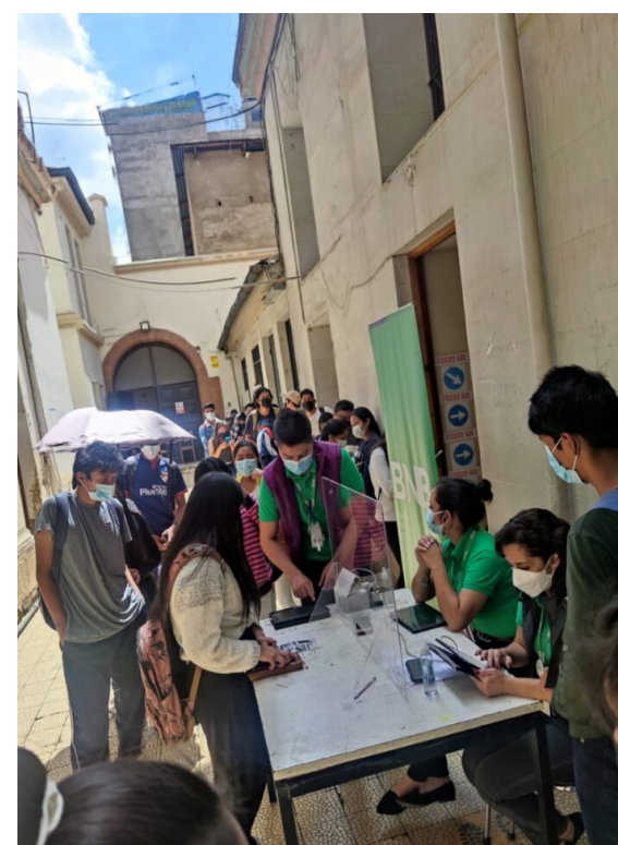
Apertura de cuentas en BNB y entrega de tarjetas a becarios