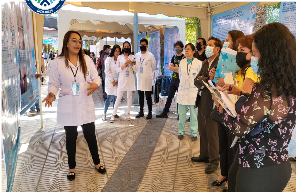
Exposición de Trabajos de Investigación - III Feria de Investigación Científica, Área Salud de la UMSS

La Dirección de Interacción Social Universitaria (DISU), durante la gestión 2022 desarrolló las siguientes estrategias y acciones de corto y largo plazo: